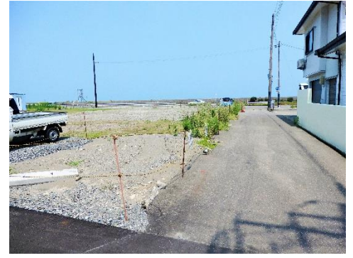
建物が建たずに空地が多いです

○「復興まちづくり計画」は、6つの重点プロジェクトを元に、平成33年度までの5か年計画で取り組みが進められる予定とのことでした。センター職員の方は、6つの中でも特に、「 にぎわいのあるまちづくり 」と「 大火の記憶を次世代につなぐ 」ことの必要性を訴えられていました。