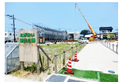
建設中のにぎわい創出広場

○午後は、糸魚川市役所を訪問し、消防署職員の方に当時の詳しい話を伺いました。当時を振り返り、合計70台もの消防車が来たけれども、命令が行き届かなかったことが最大の反省点だと仰ったことが心に残りました。また、にぎわい創出広場の地下にはこの7月に200トンの防火水槽が設置されたということでした。