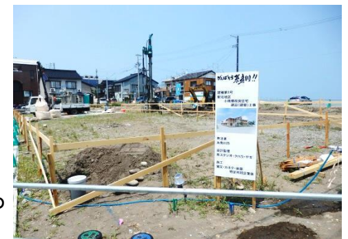
アパートの発注者は糸魚川市でした

○少子高齢化が進んでいた糸魚川市では、大火によって更に多くの市民が街を離れていき、街のにぎわいが失われ、人が戻って来ない現状をどうにかしたい、街を元気にしたいという強い思いを私達に訴えられました。