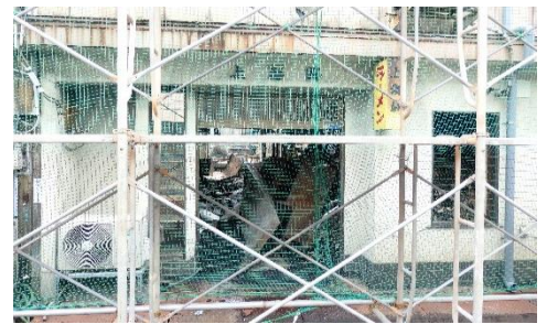
火元のラーメン店 (2017.1 撮影)

○火元のラーメン店は300㎡以下の小さな店舗のため、自動火災報知機が設置されていませんでした。そこで、とにかく火事を出さない取り組みを強化していこうと、職員の方が実際に家の中に入って、火のそばに燃えやすい物がないか、住宅用火災警報器があるか1軒1軒の見回りを始めたそうです。この地道な取り組みこそが、1人1人の防火に対する意識を高め、市民全員で街を守るという決意に繋がるのではないかと感じました。